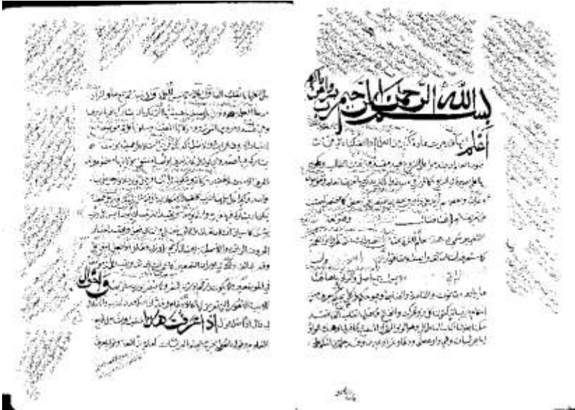
الصفحة الأولى من النسخة الثانية