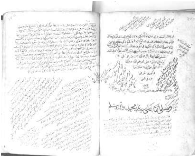
الصفحة الأخيرة من النسخة الأولى