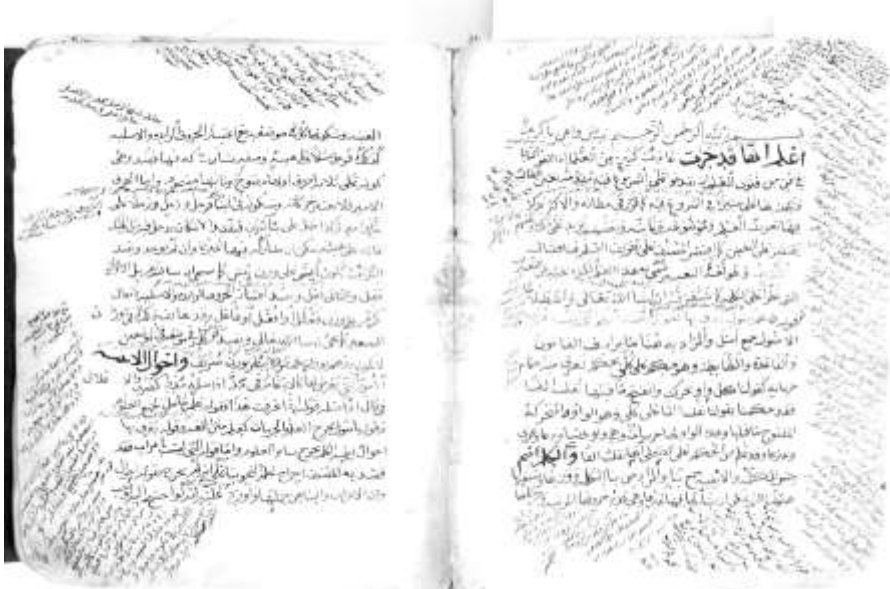
الصفحة الأولى من النسخة الأولى