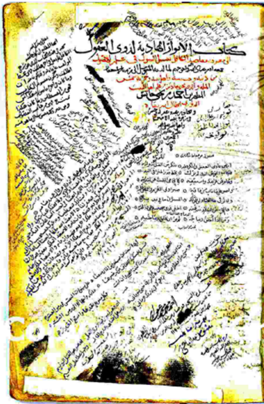
الصفحة العنوان من النسخة (د)