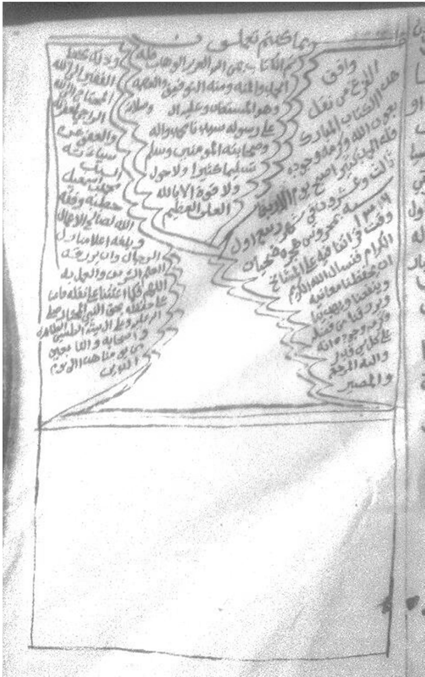
الصفحة الأخيرة من النسخة (ج)