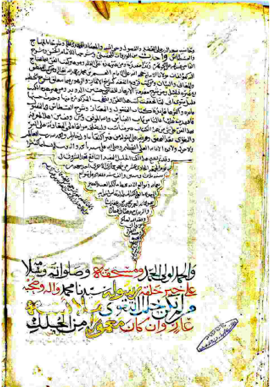
الصفحة الأخيرة من النسخة (د)